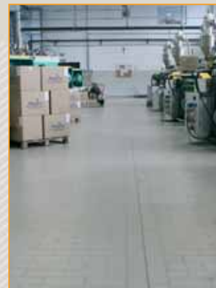
▲ ▲ ▲ hale produkcyjne i magazynowe