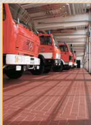
▲ ▲ ▲ posadzka wykonana z płytek Argelith obiekty użyteczności publicznej