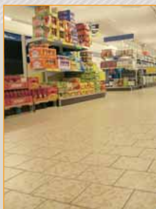
▲ ▲ ▲ obiekty handlowe: sklepy, markety, hipermarkety