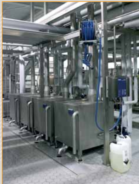
▲ przemysł spożywczy posadzka wykonana z płytek Argelith