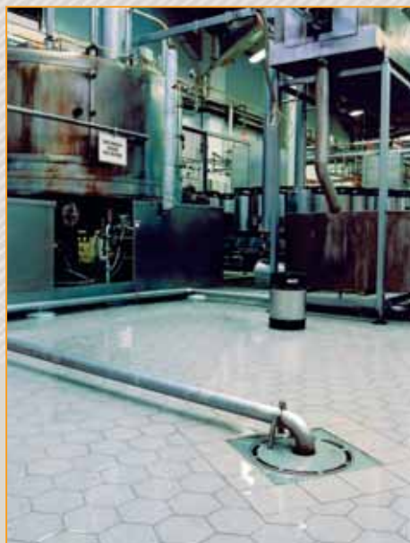
▲ zakłady chemiczne posadzka wykonana z płytek Argelith