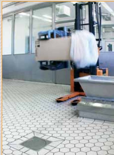
▲ przemysł farmaceutyczny posadzka wykonana z płytek Argelith